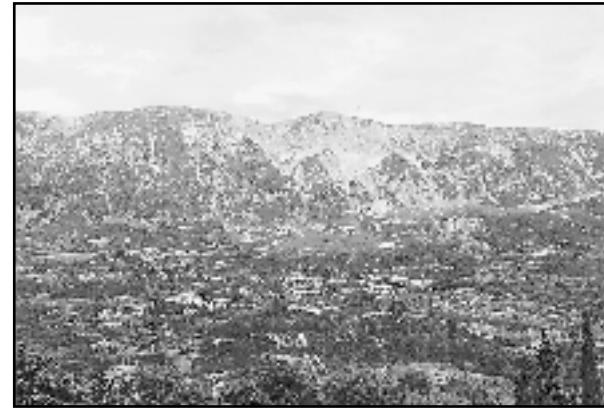
Μερική άποψη του χωριού μας με φόντο το ορατό μέρος του βουνού μας που χρόνια τώρα βρίσκεται στο επίκεντρο επιδιώξεων συμφερόντων εκμετάλλευσης - νταμαροποίησης. Αυτές τις επιδιώξεις αντιμαχόμεθα χρόνια τώρα γιατί γνωρίζουμε τις συνεπακόλουθες καταστροφικές συνέπειες του φυσικού περιβάλλοντος.