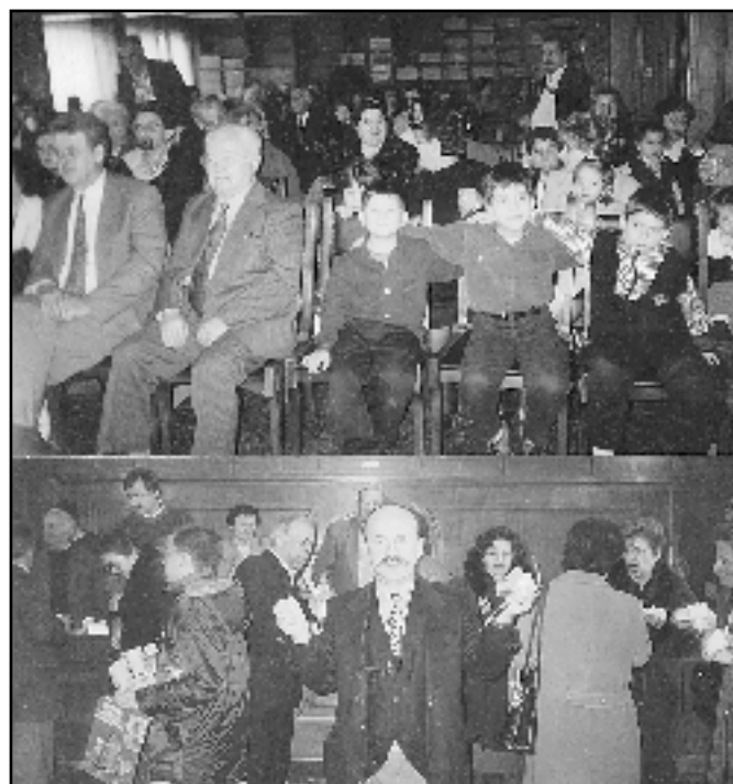
Δύο χαρακτηριστικά στιγμιότυπα από την παρελθούσα εκδήλωση της Αη-Βασιλιάτικης πίτας της Αδελφότητας.

*Σημείωση: Δεν υπήρξε γραπτή απάντηση ούτε εκπροσώπηση του Μορφωτικού Συλλόγου Παπαδατών στον Ετήσιο Χορό της Αδελφότητάς μας.