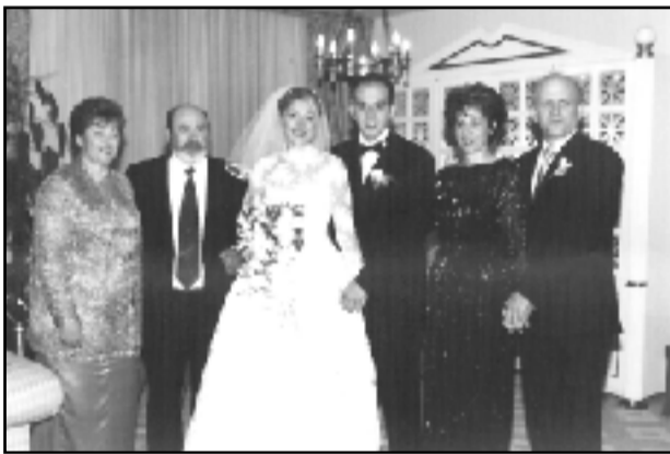
Οι ευτυχισμένοι γονείς με τα νεόνυμφα παιδιά τους.