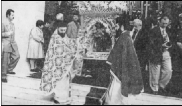
Η ιερή εικόνα του Οσίου Νίκωνος κατά τη λιτάνευσή της στη Σπάρτη