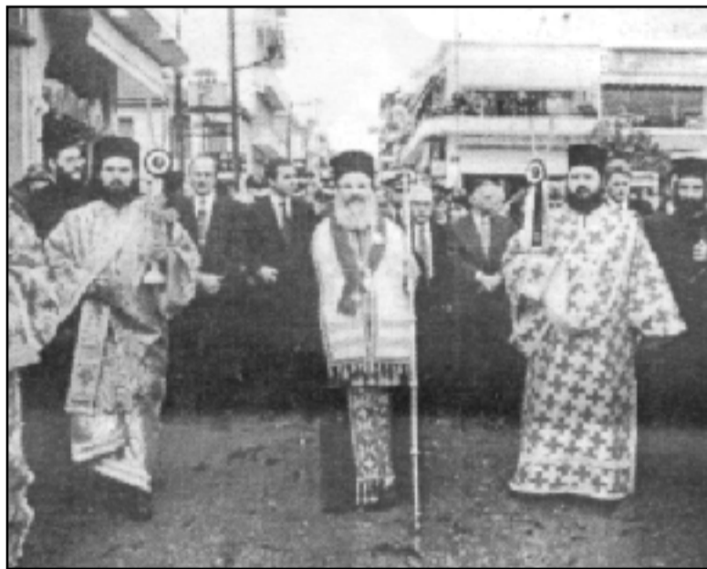
Με σεβασμό και αγάπη υποδέχθηκε ο Λακωνικός λαός τον Αρχιεπίσκοπο κ. Χριστόδουλο.

Εκπρόσωποι του πολιτικού κόσμου, ο υφυπουργός κ. Παρ. Φουντάς, οι βουλευτές κ. Δαβάκης, Σκανδαλάκης, Βαρβιτσιώτης κ.ά.