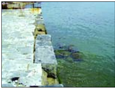
Τμήμα της προκυμαίας Γυθείου. Έτοιμο να σαλπάρει στη θάλασσα!

Όλοι γνωρίζουμε το πρόβλημα που έχει καταντήσει να είναι το βασικότερο τα τελευταία χρόνια για την πόλη μας. Αποκομιδή και εναπόθεση των απορριμμάτων. Πώς θα μάθουμε στα παιδιά μας να μην πετούν σκουπίδια στους δρόμους, να χρησιμοποιούν τους κάδους και τα καλάθια των απορριμμάτων όταν ένας ολόκληρος Δήμος είναι μια τεράστια χωματερή σκουπιδιών; Όταν αντί για τις ευωδιές και τα αρώματα της άνοιξης μας πνίγει η δυσσομία που αναδύεται από τους κάδους και τους λόφους των σκουπιδιών; Σε τι δρόμους να κυκλοφορήσουμε όταν στην μεγαλύτερη πλειοψηφία τους μοιάζουν με τους δρόμους του «βομβαρδισμένου Σεράγεβο»; Πώς να αθληθούν και να παίζουν όταν χρειάζεται να ξενιτευτούν στον ίδιο τους τον τόπο και να ταξιδεύουν στις γύρω πόλεις που υπάρχει κλειστό γυμναστήριο γιατί η αδιαφορία των δικών μας αρχόντων μας απαγόρευσε την κατασκευή του; Πού να περπατήσουν και να συζητήσουν όταν η μοναδική στην Ελλάδα μαριμάρινη προκυμαία όπου δεν καταλαμβάνεται από τραπεζάκια και καρέκλες, δεν βιά-