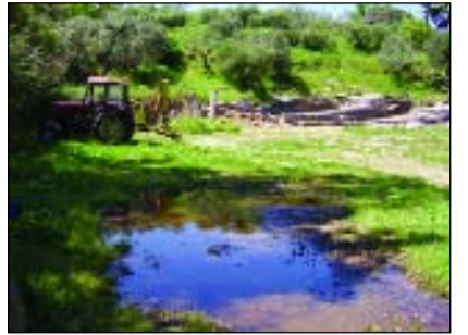
Κουίζ: Ποιά λίμνη είναι αυτή μπροστά στο αρχαίο μας θέατρο. Οποιος το βρει κερδίζει τη Δημαρχία!

φιά τους θα είναι χωρίς γαλάζιες σημαίες; Οι πλατείες θα συνεχίσουν να είναι επικίνδυνες για τα παιδιά μας; Κανείς δεν γνωρίζει τι σημαίνει πεζοδρομηση σ' αυτόν τον τόπο; Αυτό το κόσμημα που «δημιούργησε» επιστήμονες, επαγγελματίες, καλλιτέχνες, το Παρθενα-