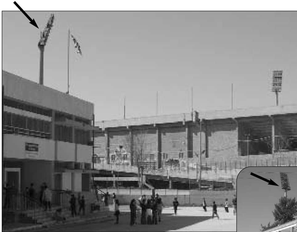
Γήπεδο Πανιωνίου - 10ο Δημ. Σχολείο Τα βέλη δείχνουν το που βρίσκονται οι κεραίες. Τα συμπεράσματα δικά σας