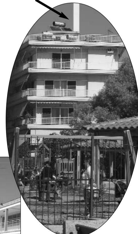
Πολυκατοικία Ελλησπόντου 81